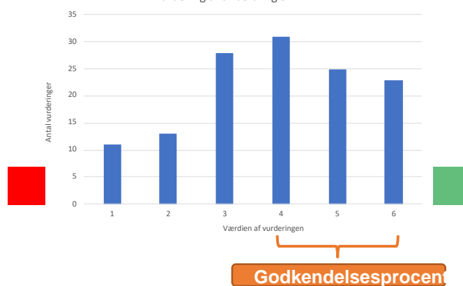
Vurdering af anbefaling 5